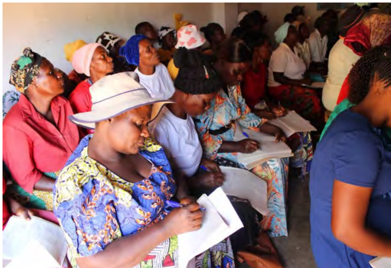
Bønder modtager undervisning om vandingssystemer.

ger, blandt småbønder, at udbrede viden om klima og miljø, samt styrke samfundets kapacitet til at håndtere klimakatastrofer. Vi ser frem til at dele opdateringer om dette projekt og dets indvirkning på lokalsamfundene i Chimanimani, Zimbabwe.