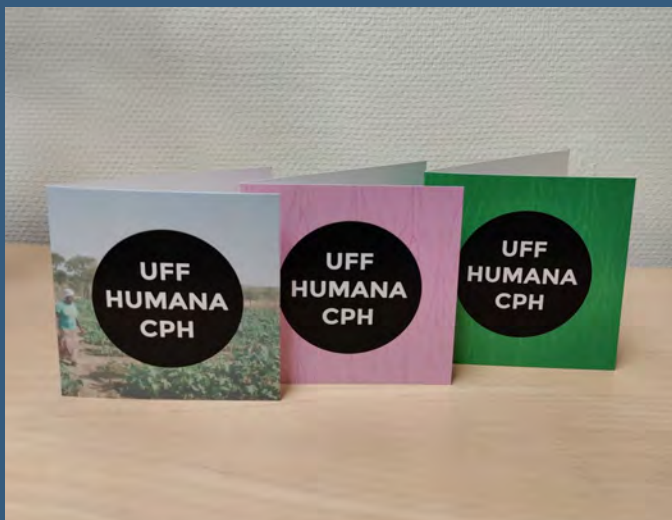
Gavekortet fås i tre forskellige versioner.

UFF Humana Second Hand har fået nye flotte gavekort, som kan købes i alle tre butikker: Vesterbrogade 50, Nørrebrogade 34 og Istedgade 97 i København.