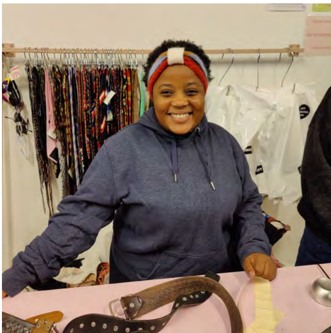
Alma gav en hånd med i UFF Humana Second Hand på Nørrebrogade.