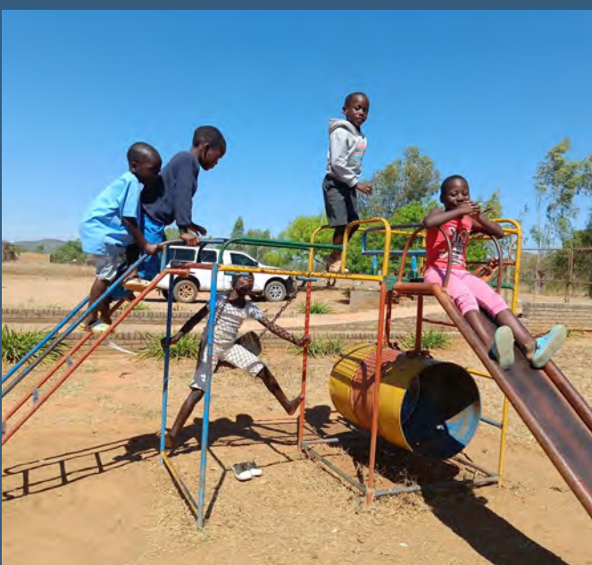
Børnehjemmets legestativ bliver flittigt brugt.