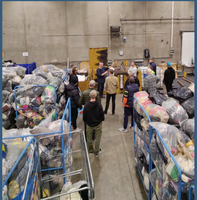
En gruppe ansatte fra ARC på besøg hos UFF-Humana.

Hos UFF-Humana mærker vi en stadigt stigende interesse fra kommunerne i at finde kompetente aftagere af det tekstilaffald, de selv samler ind, og vi er glade for at kunne bidrage til dette.