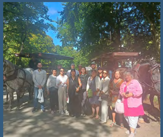
Gruppefoto med hestevognene.

I August var UFF-Humanas personale på tur til Dyrehaven. Dagen startede med en køretur i hestevogne, efterfulgt af en tur på Dyrehavsbakken, hvor de ansatte fik prøvet deres nerver af i diverse forlystelser. Dagen sluttede i mere rolige omgivelser med fællesspisning.