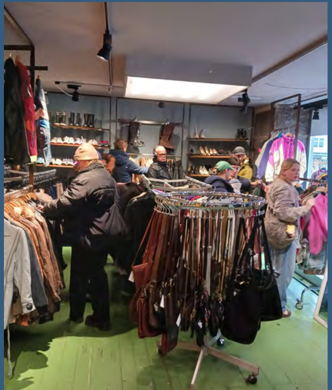
De meget stemningsfulde lokaler på Istedgade er nu fyldt med gode trend og vintage-fund.