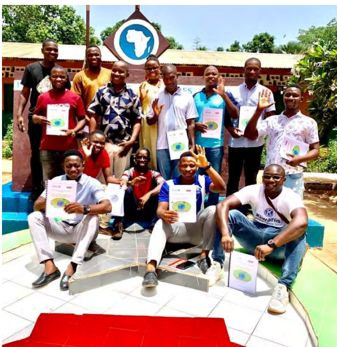
De studerende med hver deres manual om miljø og sundhed.

Lærerseminaret i Bachil i Guinea-Bissau har siden slutningen af 2023 arbejdet med et initiativ, der fokuserer på sammenhængen mellem miljø og sundhed. Forløbet handler om sundhed både for det enkelte menneske og for vores planet, og uddanner lærerne gennem tværfaglige forløb, der skal fremme miljøengagement og socialt ansvar. Det skal resultere i effektive, inkluderende og konkrete løsninger, som lærerne kan dele med de allermest sårbare mennesker, der bor i landområderne, og som har klimaforandringerne meget tæt ind på livet. Lærerne uddannes til at udvikle initiativer, der er skræddersyet til deres lokalsamfunds specifikke behov, for at fremme miljø, sundhed og klimamodstandskraft. Vi ser frem til at følge projektets videre udvikling.